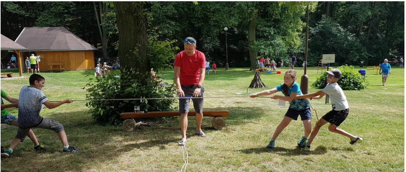
Přetahované chybělo jen bláto uprostřed.