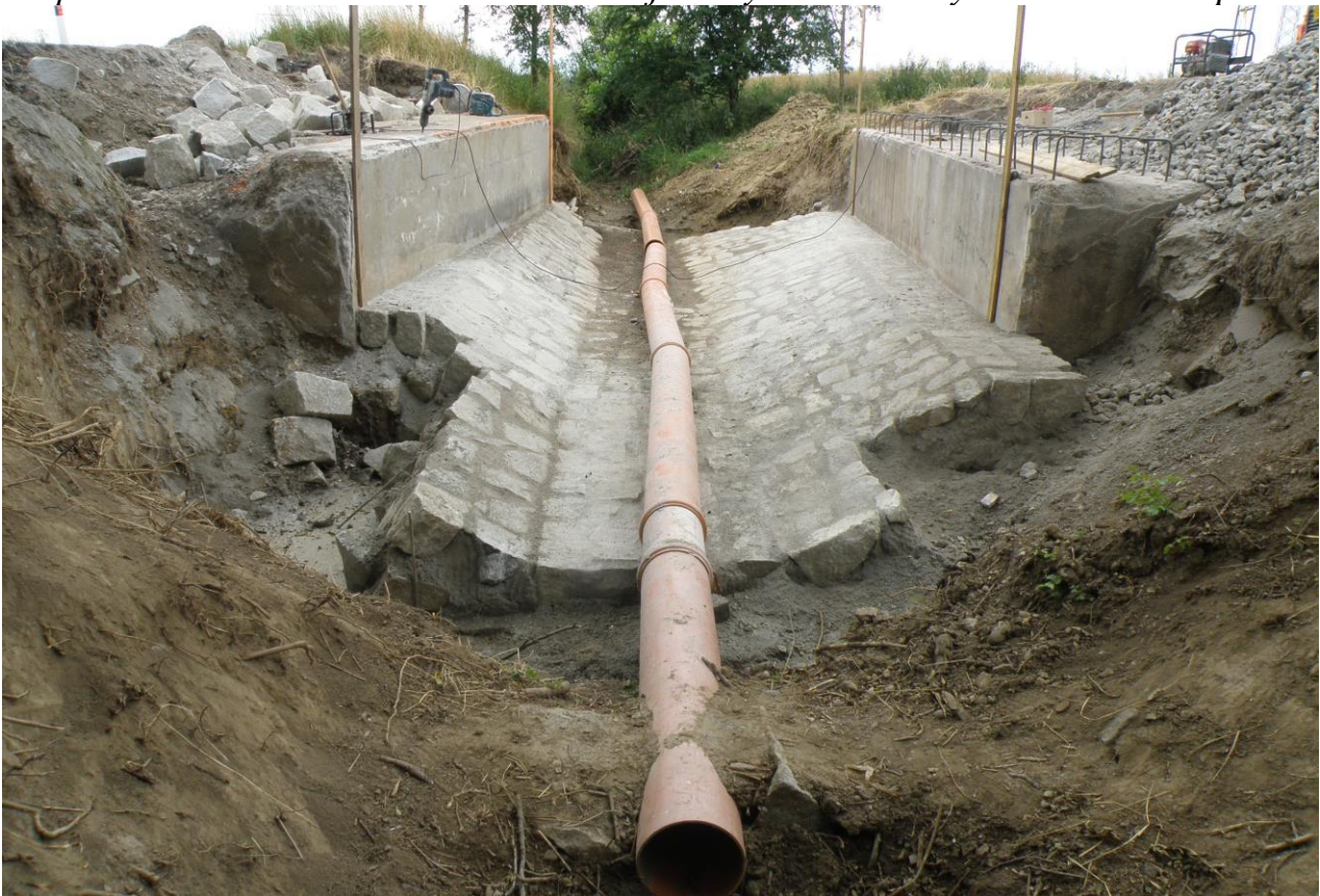
Marek Ostrčil

Stav oprav mostu na konci června – dokončuje se vydláždění koryta Dobrčického potoka.