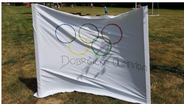
Nechyběla vlajka olympiády.