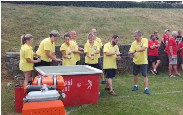
Příprava na plnění džberové stříkačky.

V sobotu 16. června se uskutečnily v Beňově již 15. mikroregionální hry. V nachystaných 9 disciplínách se utkalo 10 družtev z mikroregionu Moštěnka, jedno družstvo z mikroregionu Šlušovicko a dvě družstva z Polska – z gminy Tworóg, která je družební obcí s obcí Beňov, a z gminy Rudniki, která byla pozvaná na hry v rámci projektu česko-polské spolupráce. Družstvo obce Dobrčice obsadilo krásné 5. místo. Vyhráli soutěžící z Domaželic.