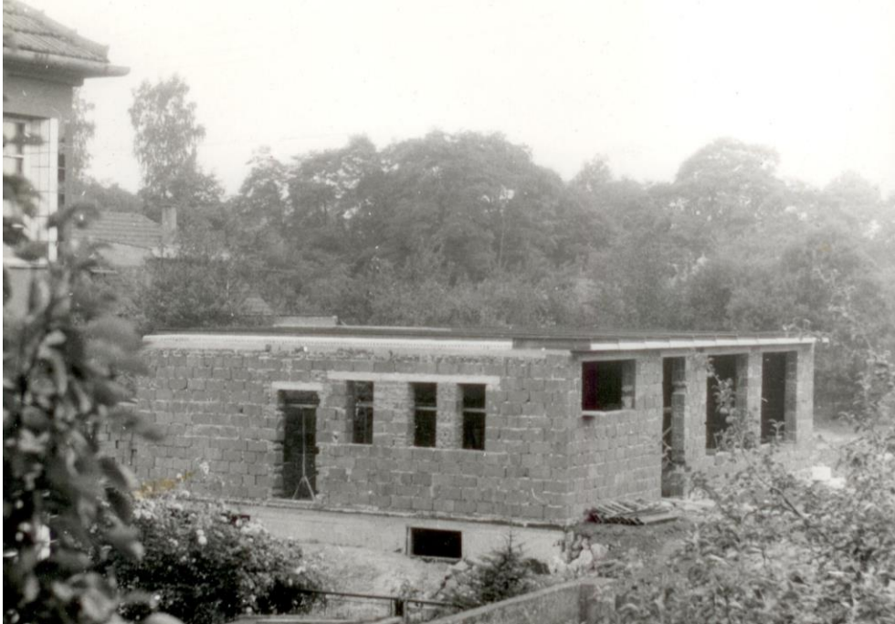
Rozestavěná budova prodejny asi z léta roku 1973. Fotografie byla pořízena z domu Ostrčilíků.

Opět vám přinášíme další fotografie ze stavby prodejny smíšeného zboží na točně.