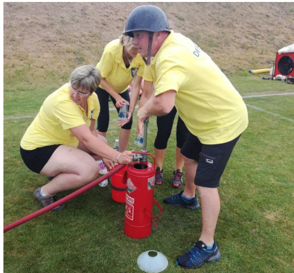
Pumpování vody džberovou stříkačkou.