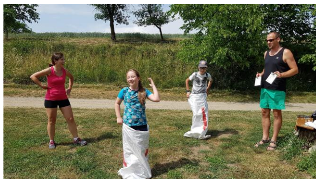
Tradiční skákání v pytlích dávalo dětem zabrat.