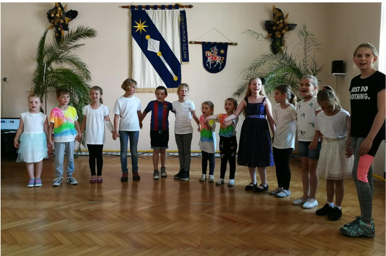
Dobřické děti při vystoupení