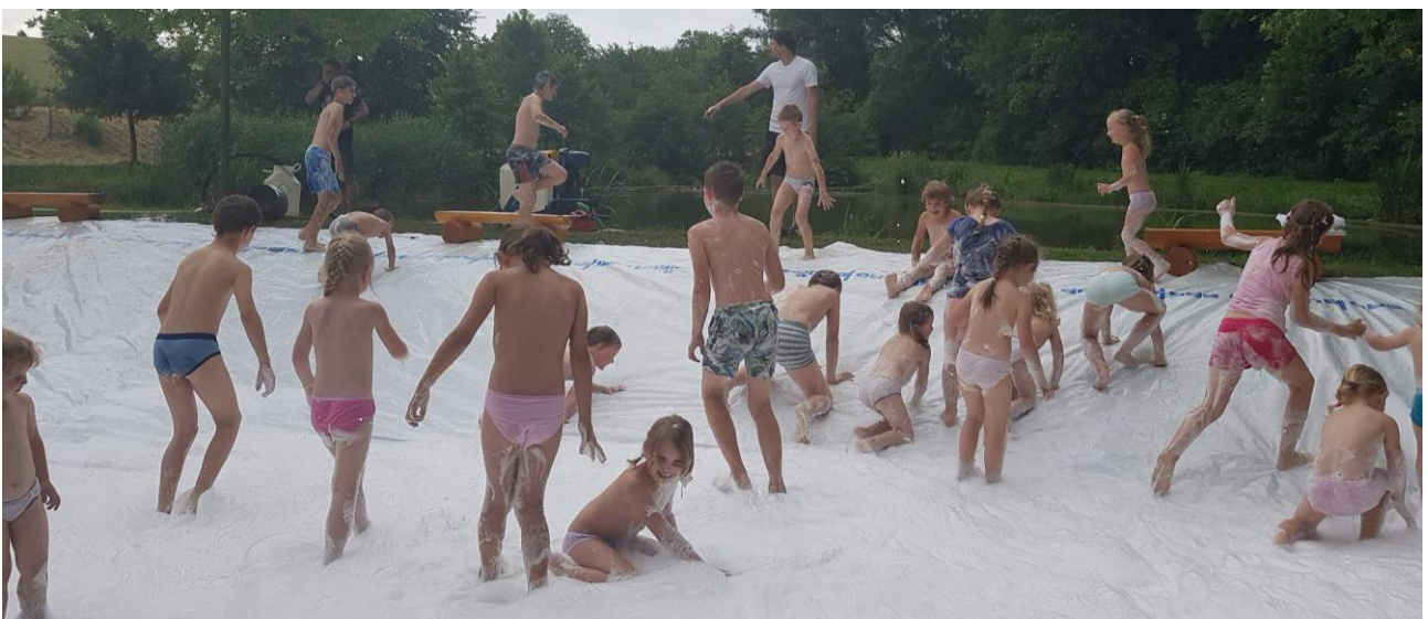
Pěna byla velkou atrakcí. fotogalerie je dostupná na webových stránkách obce