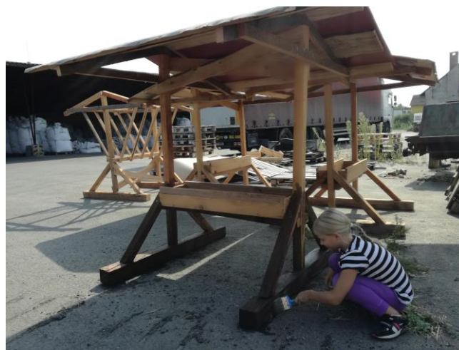
Fotografie z výroby krmných zařízení a jejich natírání (14. 5. 2017 a 25. 8. 2017).