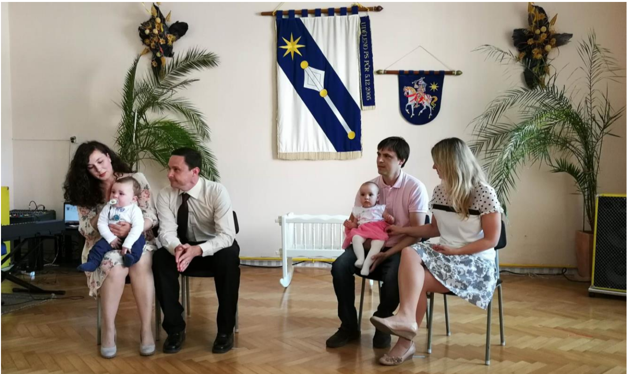
Vítané děti s rodiči.