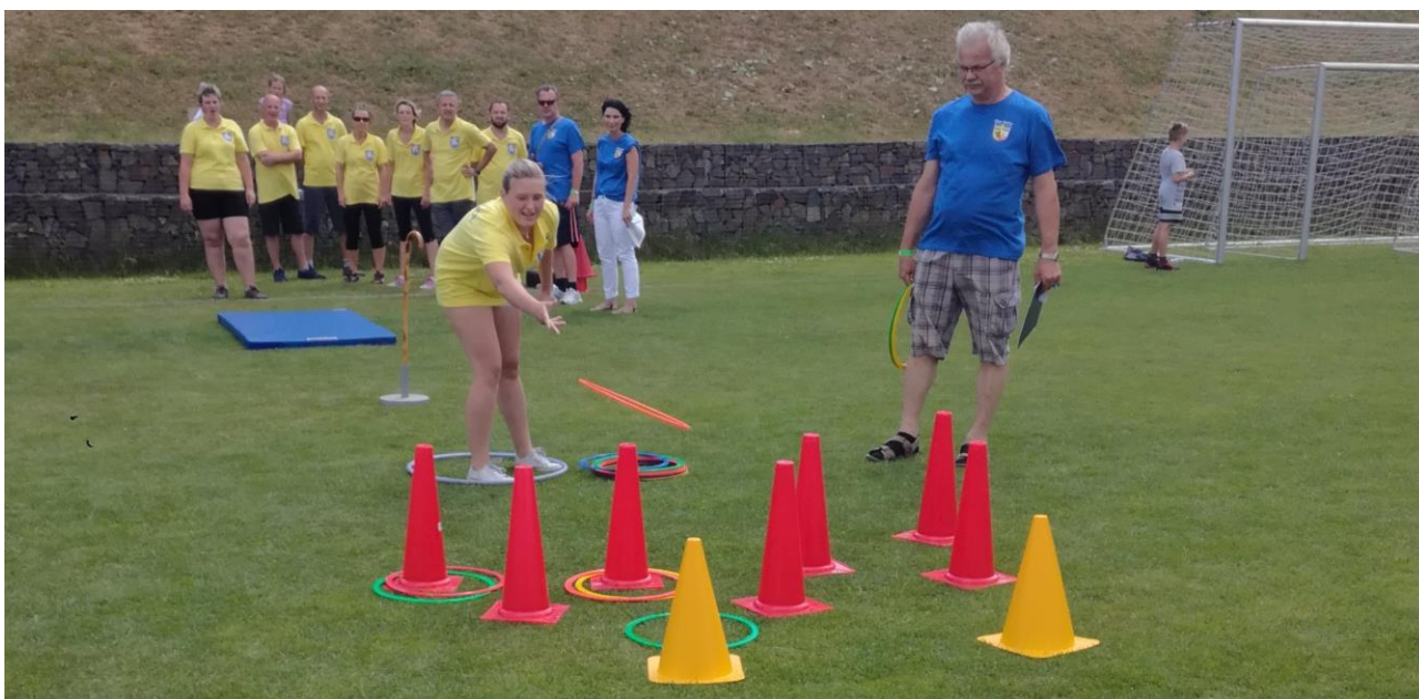
Střelba kruhy na kužele nebyla za silného větru snadná.