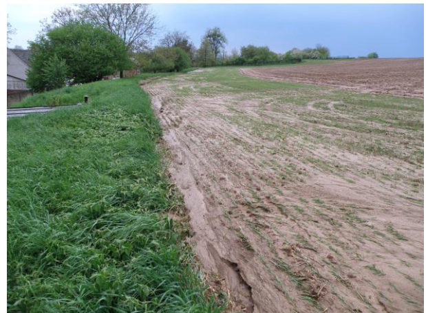
Zbytky bahna, které tekly „Ulicí“ z polní cesty na Beňov. Suché pole bez dostatečné vegetace nestačilo absorbovat přívalový déšť a spolu s vodou odteklo do vesnice i mnoho orné půdy.