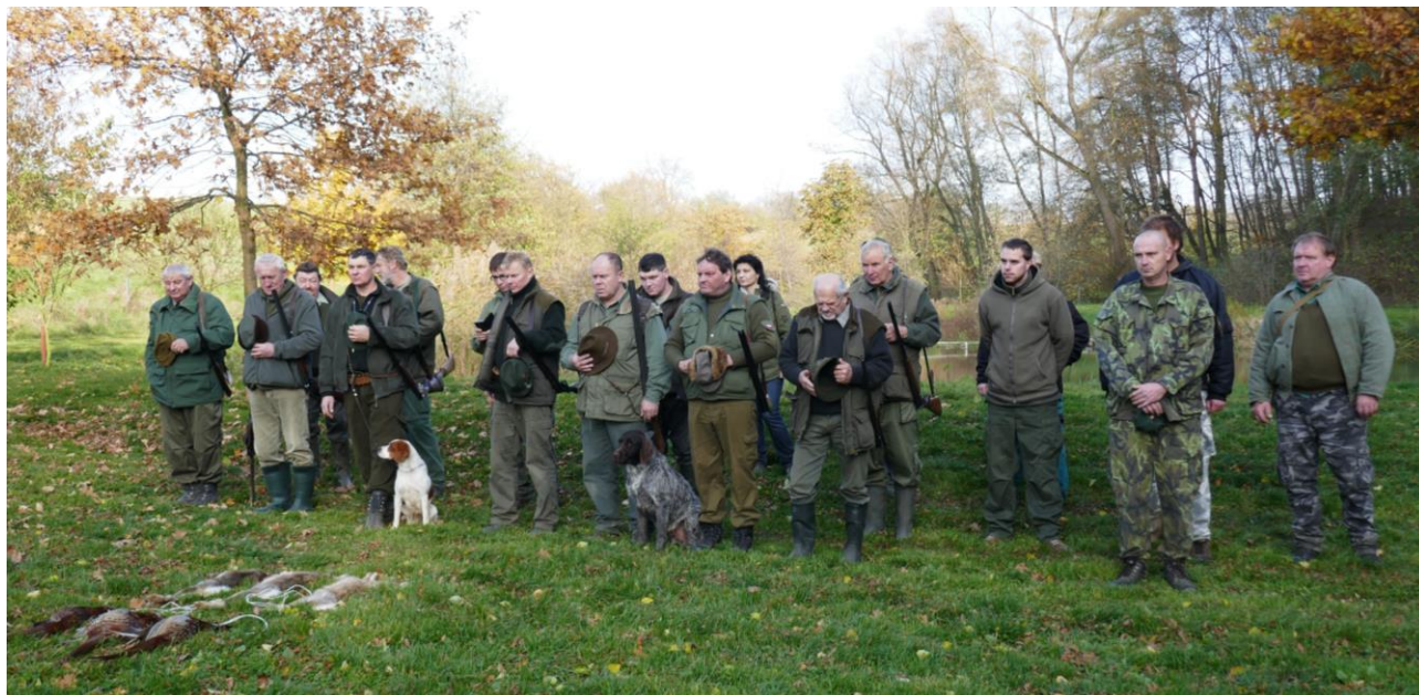
Vycházka do Dobřic 4. 11. 2017 (uloveni 3 zajíci a 3 kohouti).