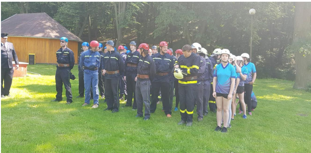
Soutěžní družstva při zahajovacím nástupu. fotogalerie je dostupná na webových stránkách obce