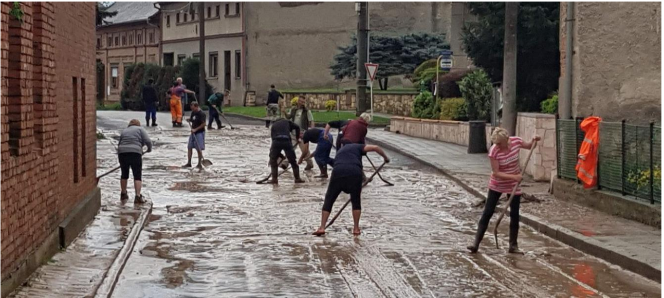
Odklizení následků bleskové povodně 23. 4. 2018. Děkujeme všem, kteří přiložili ruku k dílu.