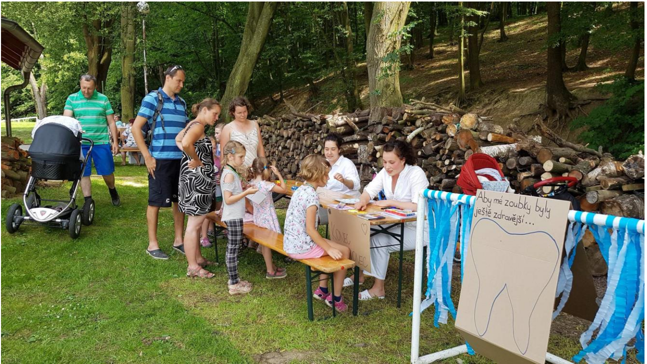
Kontrola znalostí ze zdravé výživy.