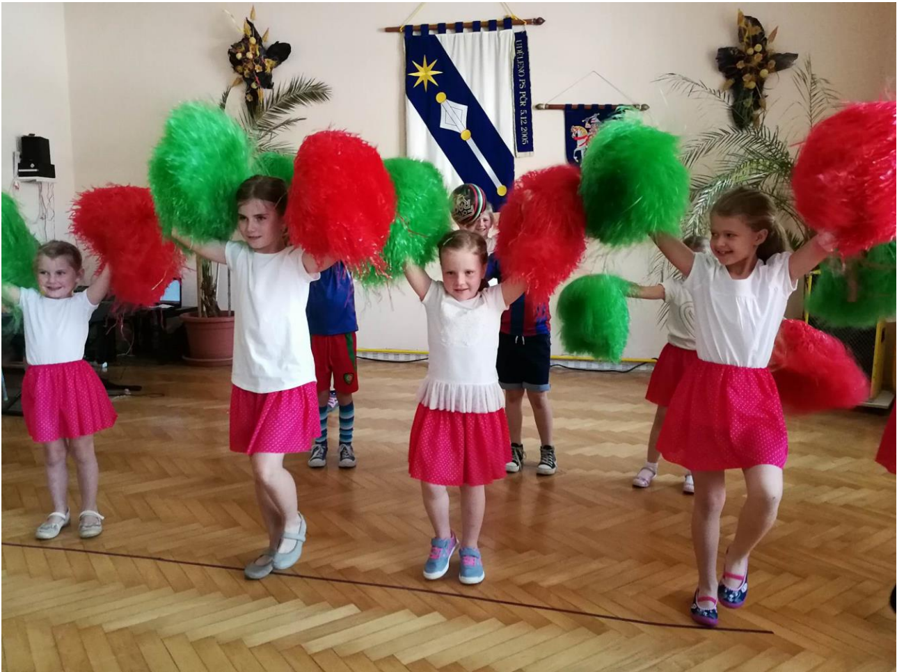
Vystupovaly také mažoretky s fotbalisty. fotogalerie je dostupná na webových stránkách obce